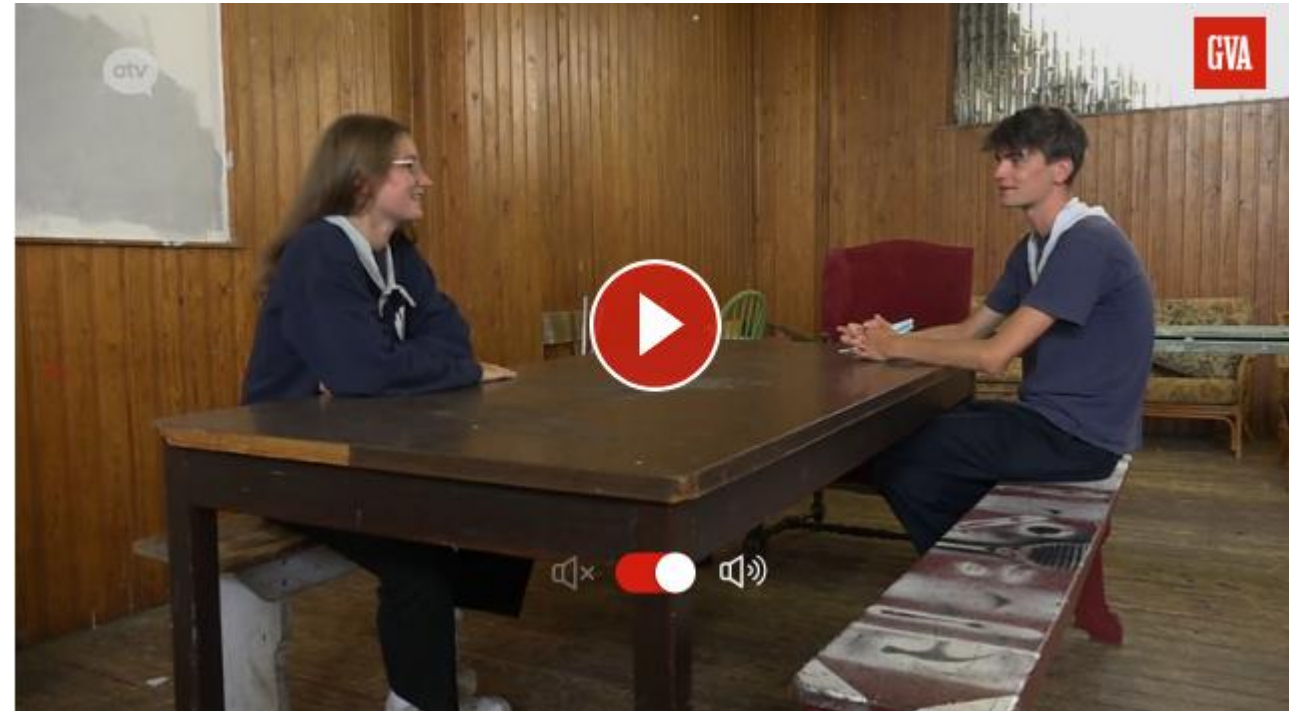
reportage ATV 19 juli 2021